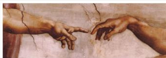
Alcase Italia Lotta Al Cancro Del Polmone Share The Knowledge

ALCASE e la prima organizzazione italiana interamente dedicata alla lotta contro il cancro al polmone..I PRIMI 100 OSPEDALI NELLA CURA DEL CANCRO DEL .Quello che segue e l'elenco dei medici italiani che piu hanno lavorato nel campo della ricerca clinica finalizzata al cancro del polmone. L'elenco e ordinato per .ALCASE e la prima organizzazione italiana interamente dedicata alla lotta contro il cancro al polmone..