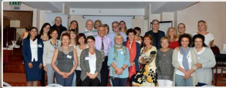
ALCASE Italia - Per la Lotta al Cancro del Polmone