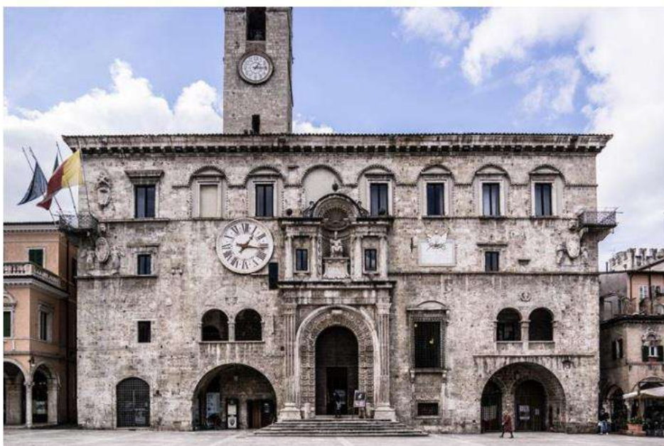
Il Palazzo dei Capitani in Piazza del Popolo

Sabato 19 novembre la torre di Palazzo dei Capitani si colorerà di bianco per la campagna "Illumina novembre", l'iniziativa dell'organizzazione nazionale di volontariato Alcase Italia Odv per la sensibilizzazione sulla lotta contro il cancro del polmone.