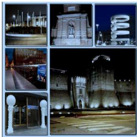
Alessandria, pubblicato da Pier Carlo Lava

Date: 17 novembre 2022 Author: alessandria today 0 Commenti