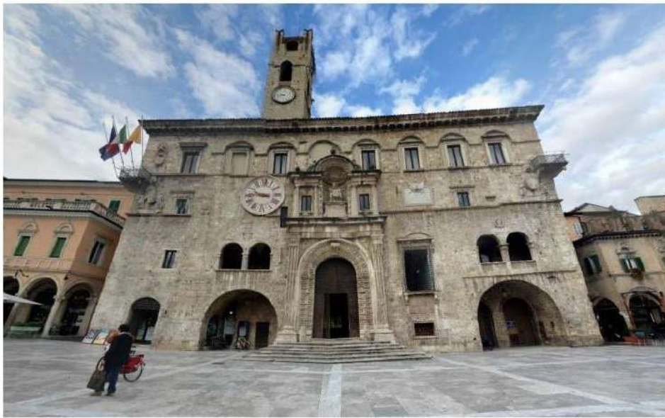
Palazzo dei Capitani

Sabato 19 novembre la torre di Palazzo dei Capitani si colorerà di bianco per la campagna "Illumina novembre", l'iniziativa dell'organizzazione nazionale di volontariato Alcase Italia Odv per la sensibilizzazione sulla lotta contro il cancro del polmone.