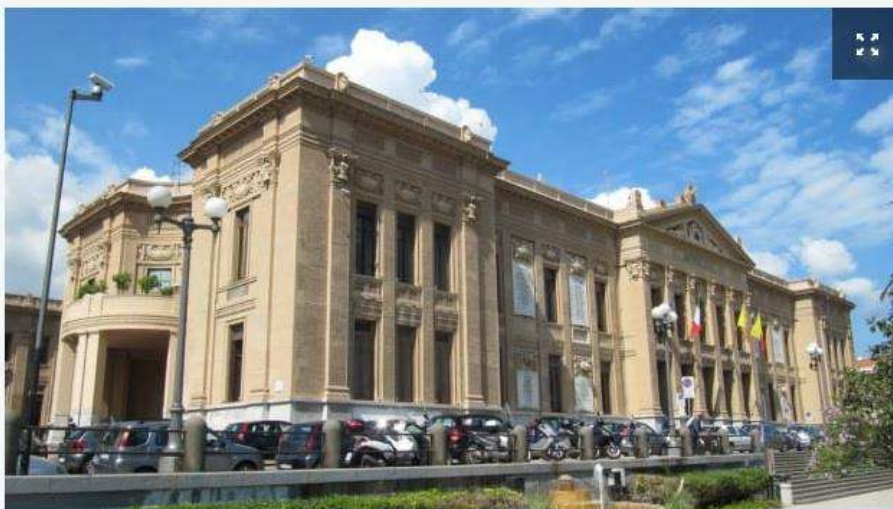
Palazzo Zanca, sede del Comune di Messina

Palazzo Zanca illuminato di bianco come segno di adesione alla campagna nazionale per il cancro al polmone.