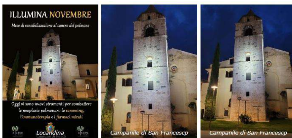
Campanile di San Francesco illuminato