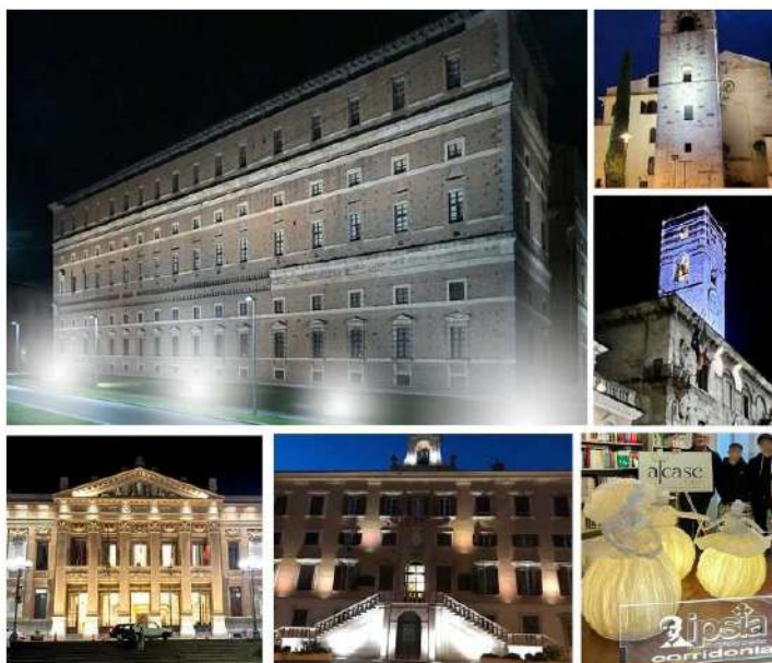
ILLUMINA NOVEMBRE, un successo anche l' 8° edizione

Quest'anno, erano tanti (e giustificati) i dubbi e le perplessità sul fatto che, causa crisi energetica, le amministrazioni comunali avrebbero pienamente potuto aderire a ILLUMINA NOVEMBRE - 2022. E nonostante, l'organizzazione no-profit ALCASE Italia ci ha provato con convinzione. Per almeno due buoni motivi: 1.) perché i malati e le loro famiglie ricevano l'attenzione dovuta e 2.) perché le persone sane, ma a rischio di sviluppare un cancro del polmone, sappiano che oggi è possibile prevenirlo efficacemente.